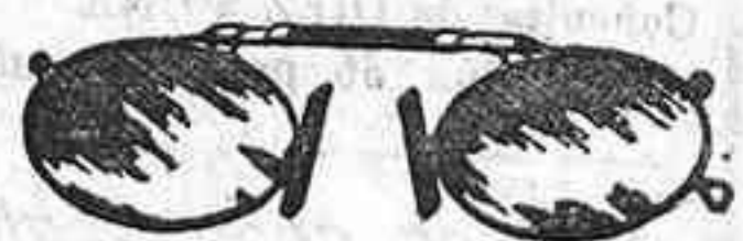
Lentes o Gatas de CRISTAL ROCA, 5 Pesetas.