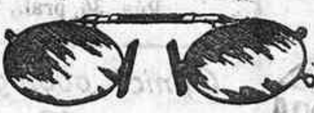
Lentes o Gafas de CRISTAL ROCA, 5 Pesetas.