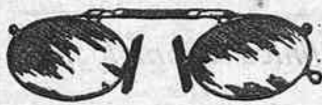
Lentes o Gatas de CRISTAL ROCA, 5 Pesetas.