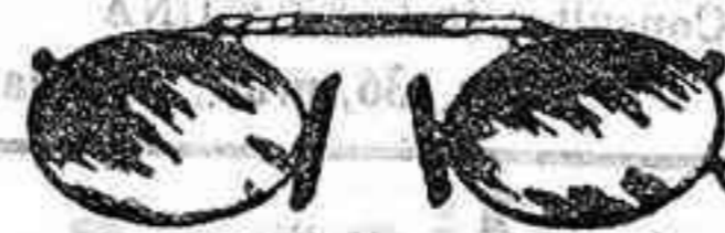
Lentes o Gafas de CRISTAL ROCA, 5 Pesetas.