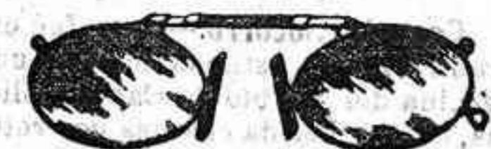
Lentes o Gatas de CRISTAL ROCA, 5 Pesetas.