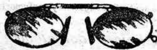
Lentes o Gatas de CRISTAL ROCA, 5 Pesetas.