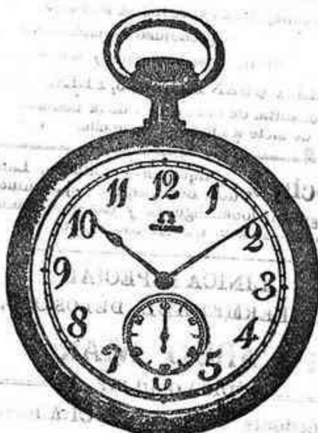
OMEGA LEGITIMO, a 27, Pesetas.