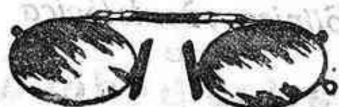
Lentes o Gafas de CRISTAL ROCA, 5 Pesetas.