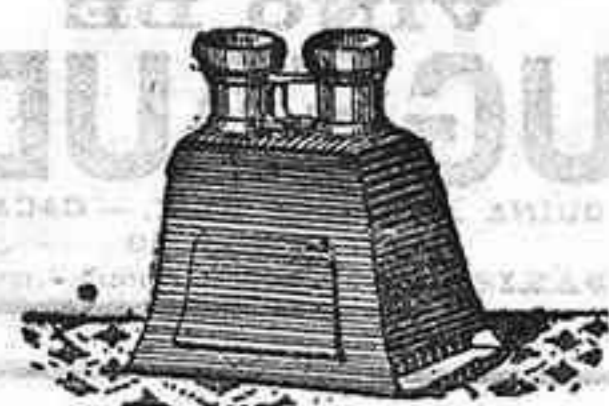
Stereoscopio y doce vistas exposición de 1900. 12'50 PTS.

PLACAS Y PAPELES DE LUMIERE, GULLENINOT, ST. CLAIR, LIESEGANG, AMERICANAS Y ALEMANAS