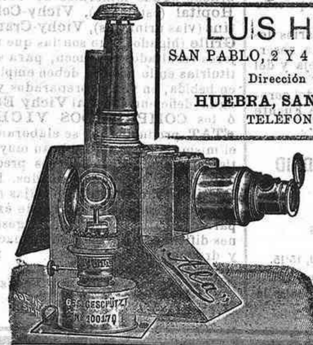
Aparatos de proyección completos, desde 125 pts.

LUIS HUEBRA SAN PABLO, 2 Y 4 SALAMANCA Dirección telegráfica: HUEBRA, SAN PABLO, 2 Y 4 TELÉFONOS, 88 Y 41