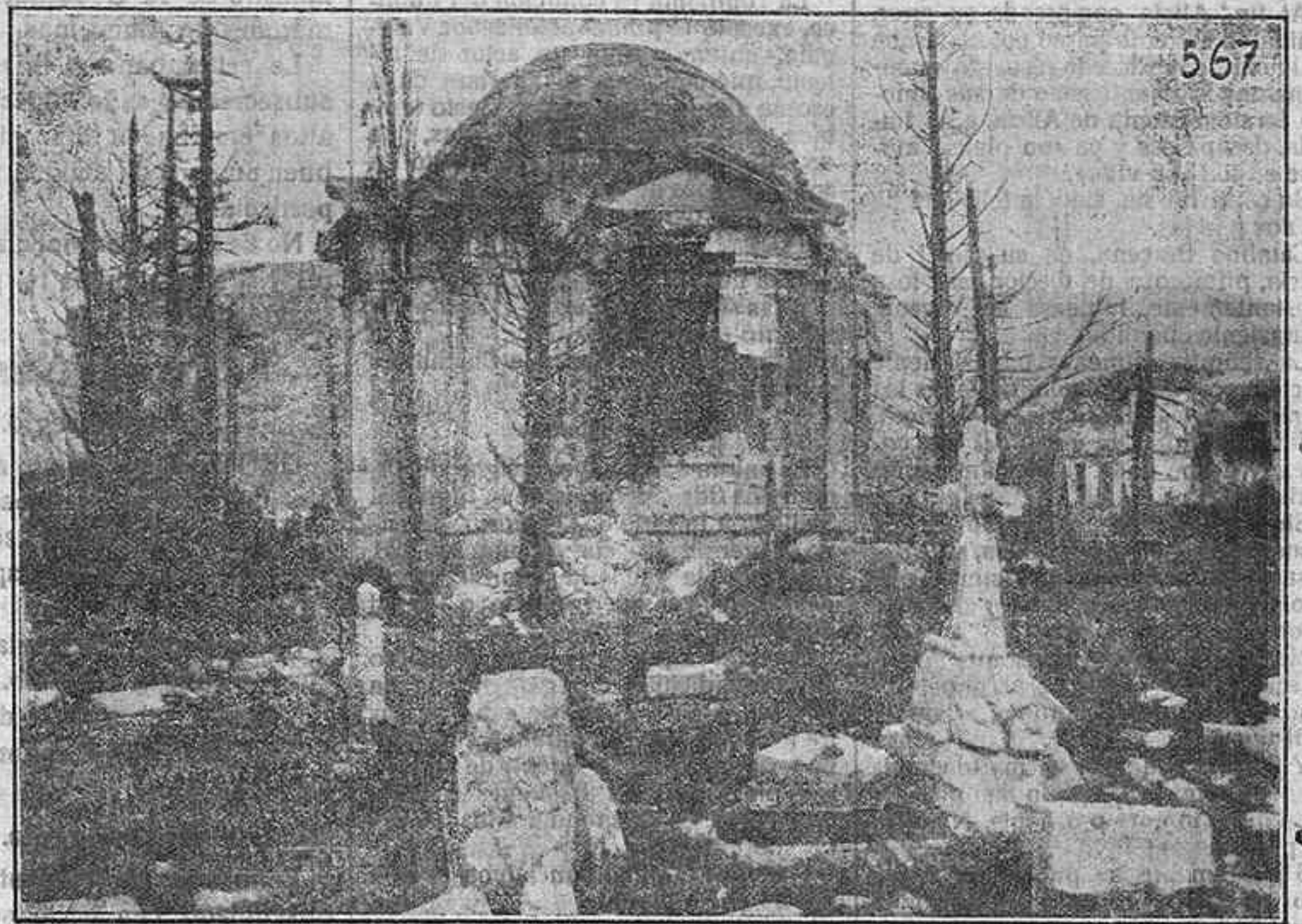
El cementerio destruido de Gorizia.

hacían aparecer a éste remozado por completo y la fama de que venían precedidas la producción de Benavente y la actriz que encarnaba el papel de la protagonista, llevaron a él un público distinguido y numeroso que llenaba todas las localidades y le daba aspecto brillantísimo.