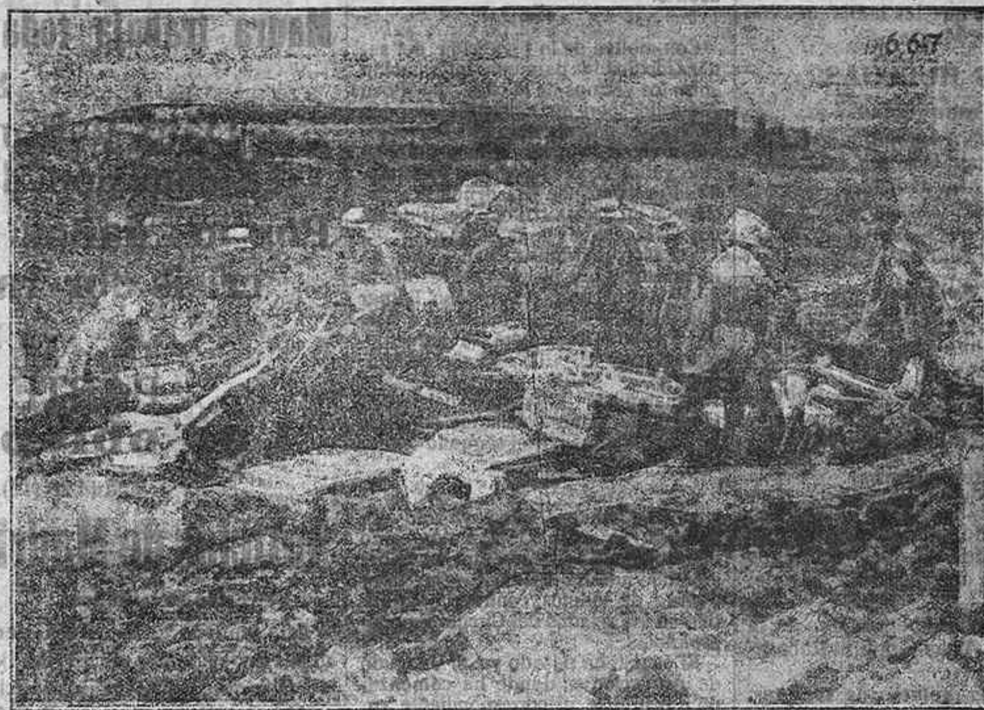
La gran ofensiva alemana en Francia.—Batería de morteros pesados ingleses conquistada por los alemanes en el sector del monte Kemmel.