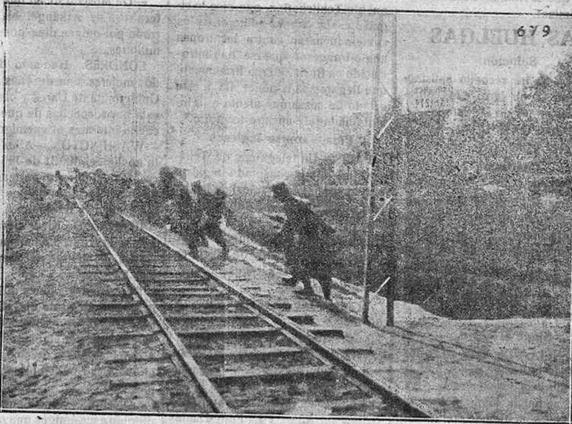
Los alemanes en Finlandia.—Tropas alemanas persiguen a la Guardia Roja.