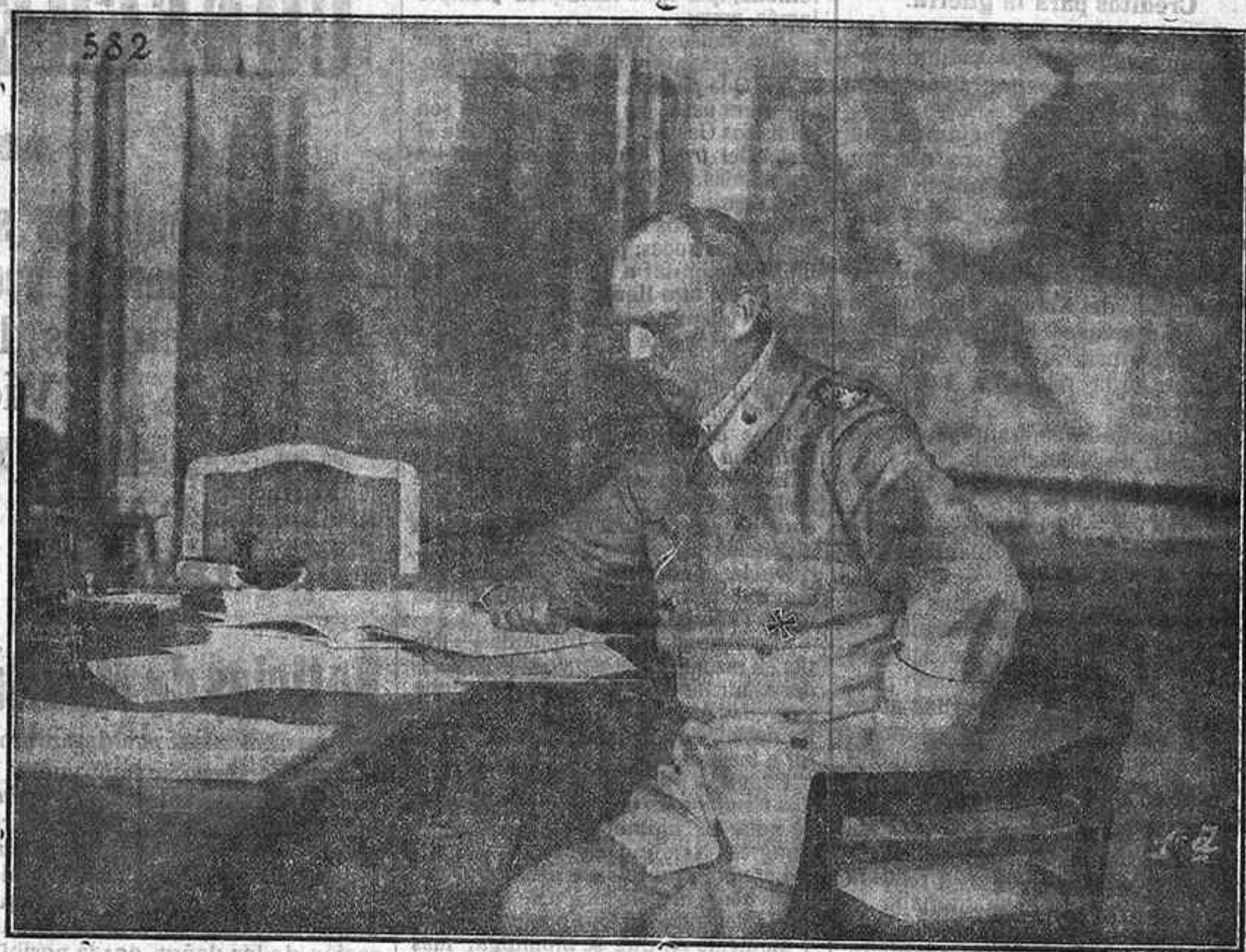
El general Ludendorff, jefe del Estado Mayor alemán, que en unión de Hindenburg dirige la actual ofensiva en Francia.

este servicio, podía ser una fuente de ingresos para el Municipio.