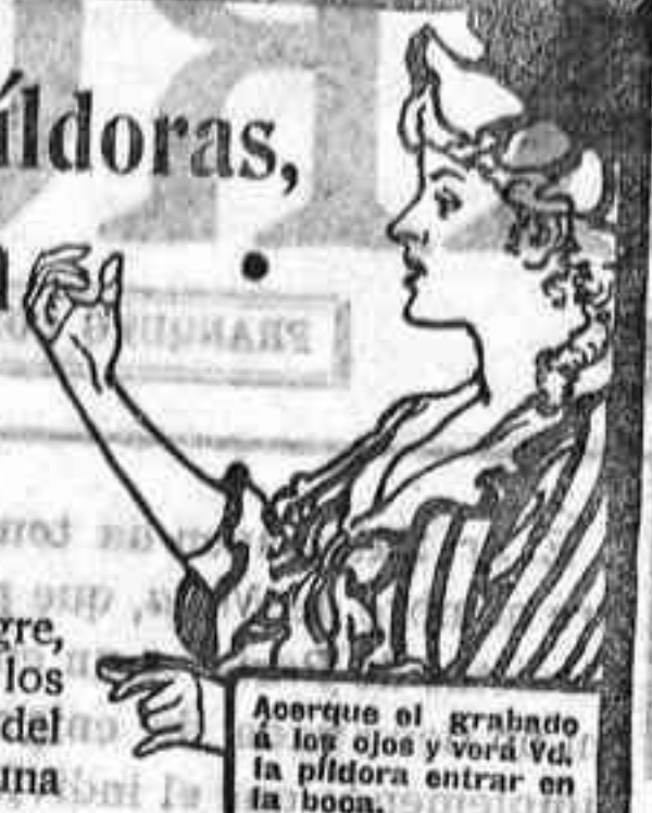
Ahorre el granado a los ojos y vora Vd. la píldora en un ratito en la boca.