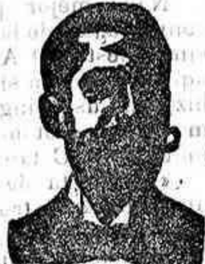
An golo Costanzi Dip. 435, Barcelona

ALMACEN DE CERAMICA para jardineria y baño. — 2, ARCO, 2, — BAJO.