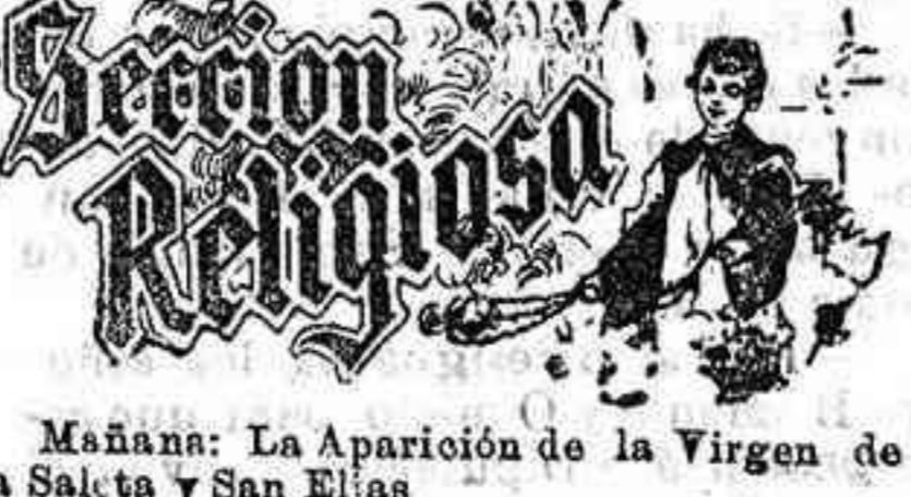
Mañana: La Aparición de la Virgen de la Saleta y San Elias