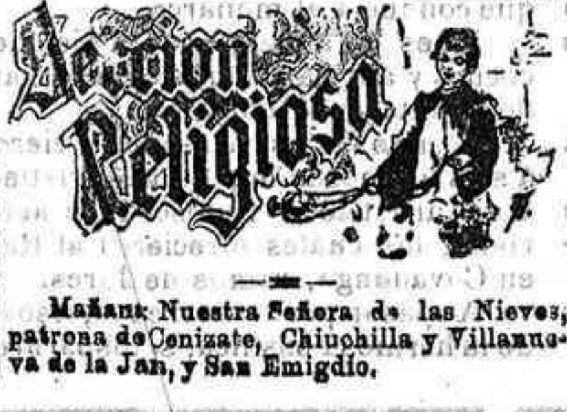
Mañana: Nuestra Señora de las Nieves, patrona de Conzate, Chinchilla y Villanueva de la Jara, y San Emigdio.