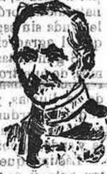
Ejerció el cargo de capitán gene-