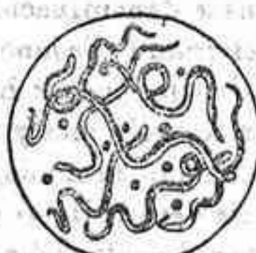
Lombriz de la sangre del hombre

Existe también la Lombriz de la sangre del hombre, que produce la terrible enfermedad conocida con el nombre de Elefantiasis, muy fre-