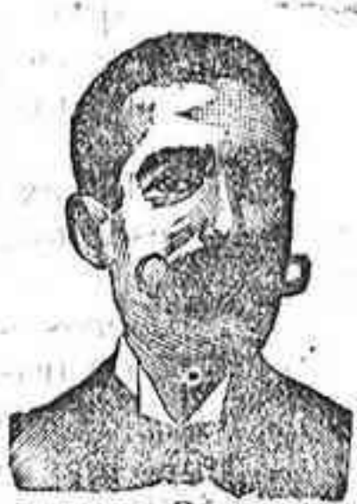
Angelo Costanzi Dip., 435, Barcelona

Ladrillos prensados, tejas tubera, bloques y pavimentos. Atenciones de Manises e Ind. — 2, ARCO, 2. — BAJO