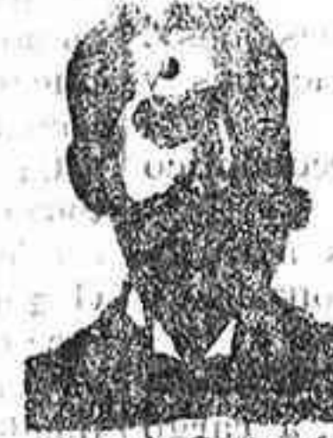
Angelo Costanzi Dip. 435, Barcelona

CHOCOLATES Y CAFES de la CO. PANIA COLONIAL RECOMENDADA POR LOS INDUSTRIALES Depósito central: Calle Mayor, 18, v. 20, MADRID