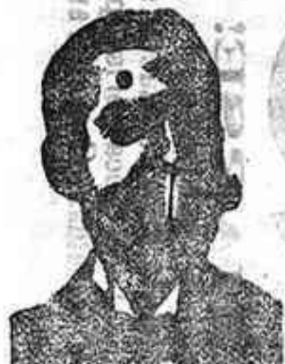
Angelo Costanzi Dip., 435, Barcelona

Miles y miles de celebridades médicas, después de una larga experiencia, se han convenido y certificado, que para curar radicalmente en dos ó tres días la purgación reciente y en cinco ó seis días la crónica, gona, gota, migraña, cólicos, dajo bñaco de las mujeres, arañitas, catarrho de la vejiga, escurros uretrales; cálculos, retención de orina, y en veinte ó treinta días los extrínsecos uretrales (est. echez), aun que sean crónicos de más de 20 años, evitando las peligrosísimas consecuencias, no hay medicamento más milagroso que los CONFITES ó Inyección Costanzi.