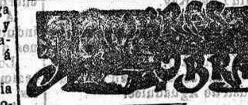
Jorge IV de Inglaterra

El domingo se celebrará en los jardines del Buen Retiro el ya anunciado banquete en honor de Canalejas. Es de mucha consideración el número de adhesiones recibidas. Se espera que haga Canalejas declaraciones de resonancia.