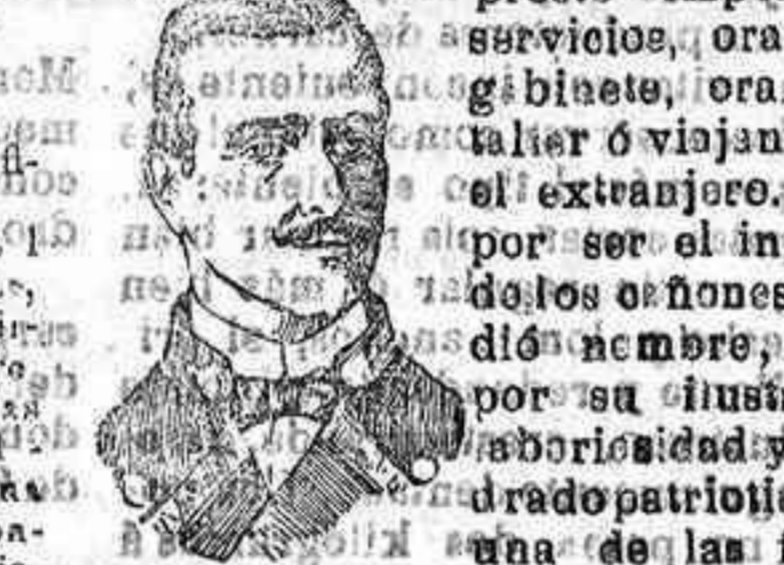
... más salientes del cuerpo de Artillería de la Armada, el cual puede estar orgulloso de haberlo contado entre los suyos...

... gulloso de haberlo contado entre los suyos, así como en San Lúcar de Barrameda, su cuna.