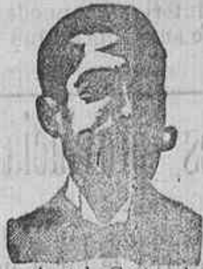
Angelo Costanzi Dip. 435, Barcelona

Depósito central del doctor ABRAS XIFRA , 10 Argensola—10, Farmacia, Madrid.—Véndese en Salamanca, en todas las farmacias y droguerías. En Filipinas: Ruberts y, Guamis, Manila.