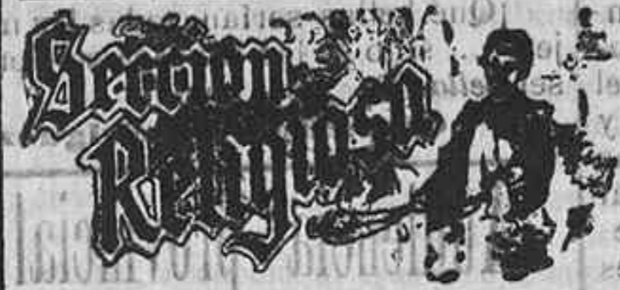
Mañana: Santa Inés, virgen, y San Eulogio.

Nuestros representantes harán seguramente cuanto preciso sea y conseguirán que el señor Ministro, que en su espíritu progresivo se ha mostrado siempre dispuesto á favorecer nuestras legítimas aspiraciones, sin que su reconocida rectitud y justicia pueda doblegarse á extrañas y egoístas ingerencias, termine de un modo satisfactorio este estado de cosas en bien de la histórica Universidad y de este pueblo sufrido y humilde, que cifra sus esperanzas en aquellos á quienes confirió poderes representativos, para que velasen por su derecho, por su prestigio y por su honra.