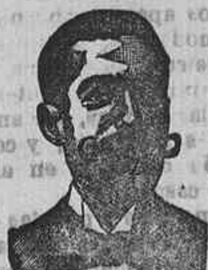
Angelo Costanzi Dip. 435, Barcelona

Preparación la más eficaz para curar la tuberculosis, catarrós crónicos, bronquitis, infecciones gripales, enfermedades consuntivas, inapetencia, debilidad general, postración, nerviosismo, neurastenia, impotencia, enfermedades mentales, caries, raquitismo, escrofulismo etc. Frasco 2'50 pesetas. DEPÓSITO: Farmacia del Dr. Benedicto, San Bernardo 41, Madrid y en la provincia Salamanca, de farmacia del Lido. Rodilla. Guijuelo.