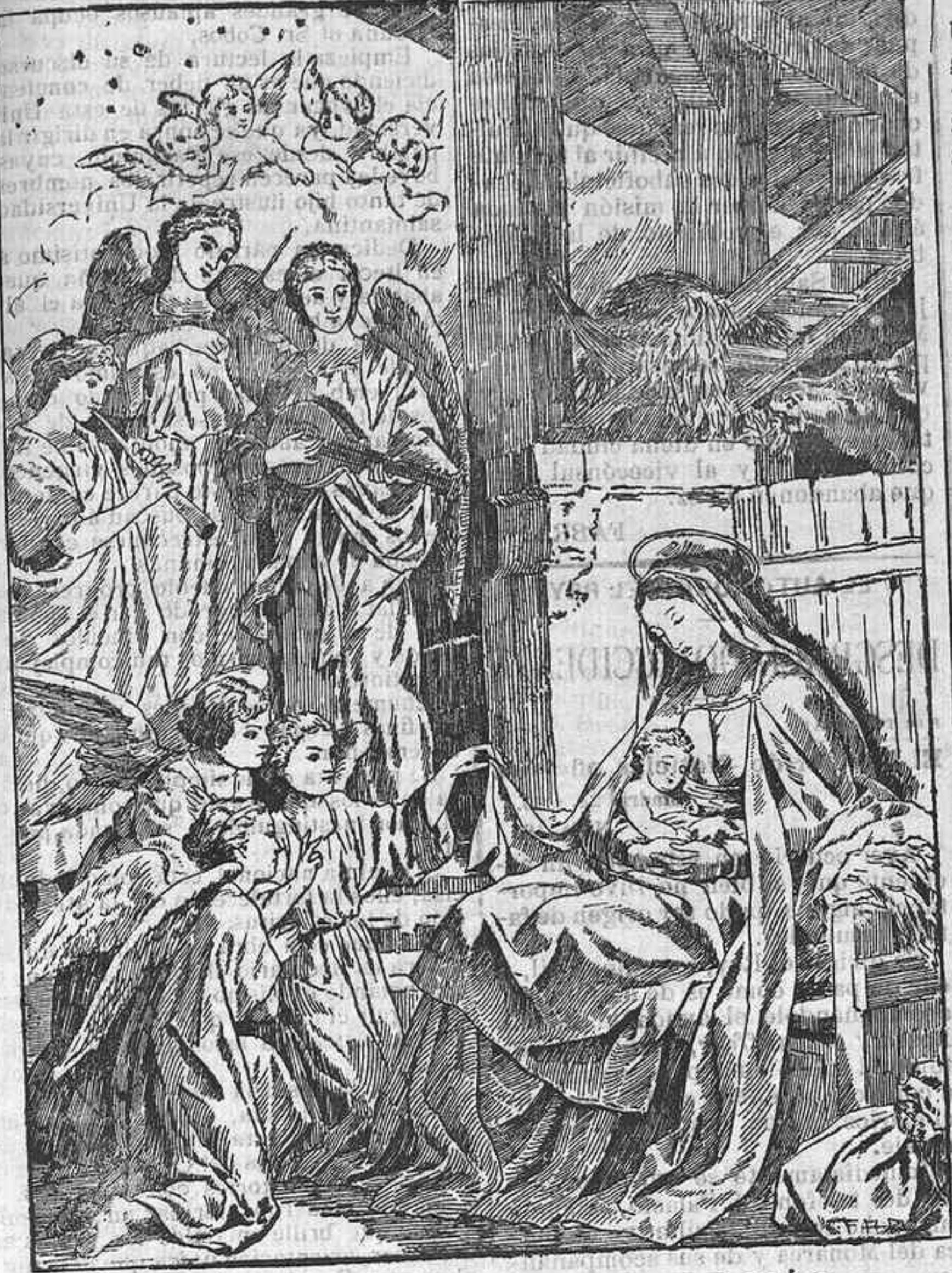
EL NACIMIENTO DE JESÚS CUADRO DE VAUGHMAN

DIRECCIÓN Y ADMINISTRACIÓN Plazuela Episcopal, número 4, entresuelo Teléfono número 154 APARTADO DE CORREOS, NÚMERO 24 DOS EDICIONES DIARIAS ANUNCIOS Precios convencionales COMUNICADOS A PESETA LA LÍNEA