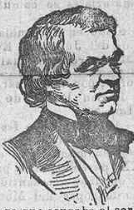
go que ocupaba al ser asesinado Lincoln, al cual sucedió en la presidencia.

En su rápida carrera política llegó á senador en 1857 y poco después á vicepresidente de la República, cargo que ocupaba al ser asesinado Lincoln, al cual sucedió en la presidencia.