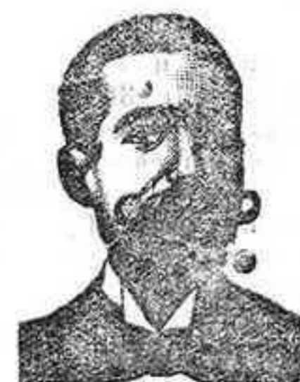
SA V I COSTANZI Diputación, 435, Barcel.

Ladrillos prensados, tejas, tuberías baldosas, bloques y pavimentos. Azulejos de Manises é ingleses y macetas para jardineras y saón.