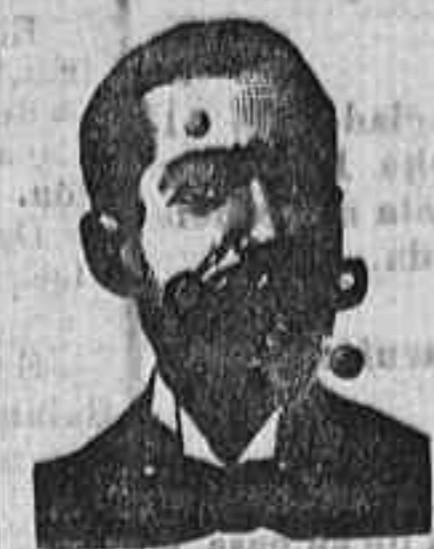
SALV. COSTANZI Diputación, 435, Barcel.

ALMACEN DE CERAMICA ARCO.—2 BAJO Ladrillos prensados, tejas, tuberías, bloques y pavimentos. Azulejos de Manises é ingleses y macetas para jardines y salón.