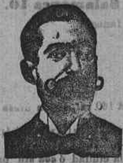
DR. SALVIATI COSTANZI Diputación, 435, Barceló.

Preparación la más racional para curar la tuberculosis, catarros crónicos, bronquitis, infecciones gripales, enfermedades consuntivas, inapetencia, debilidad general, prostración nerviosa, neurastenia, impotencia, enfermedades mentales, caries, raquitismo, escrofulismo, etc. FRANCO, 277, pesetas; DEPÓSITO: Farmacia del Dr. Benedicto, San Bernardo, 41, Madrid, y en la provincia de Salamanca, farmacia del Ldo. Rodilo, Guajuelo.