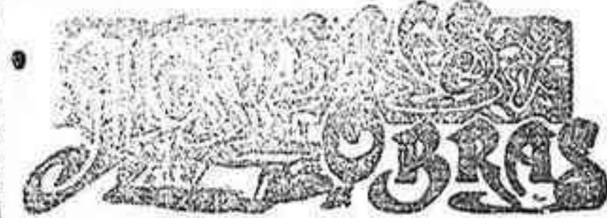
Rodríguez Rubí 21 de Diciembre.

¡Y luego dicen que no influye en la suerte de los estados la gramática! Pues ¿qué es esto más que gramática... parda? POLIT Y CANTRO.