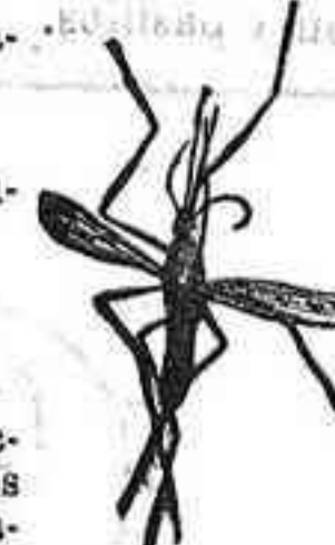
Anofelo Mosquito que propaga la fiebre palúdica

El conde de Romanones opina por su parte que al país debe dársele un respiro, de lo cual se halla muy necesitado, imponiéndose un aplazamiento en la solución de las candentes cuestiones políticas que actualmente se discuten. Añade que él ha pulsado la opinión, y que conoce el estado de ella, creyendo preciso trabajar por que la hoguera no se convierta en incendio