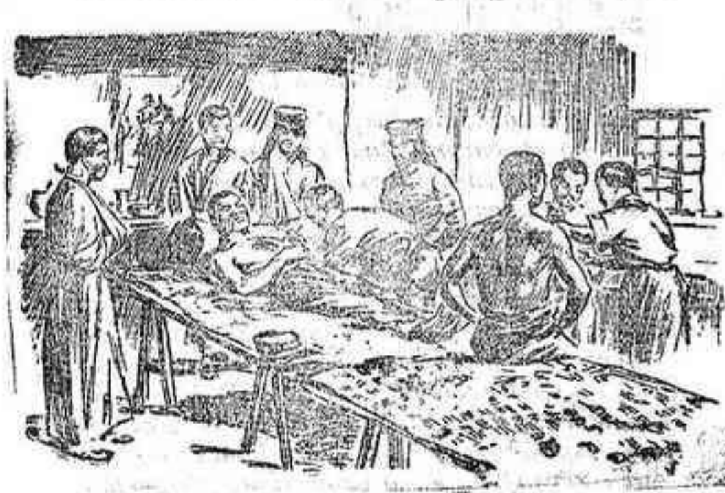
Cirujanos japoneses operando a los heridos en un hospital de sangre

Gran exposicion de plantas EN ESTA CIUDAD de la casa Balmé y C. de LYON (FRANCIA). Toda clase de plantas, árboles y arbustos que se deseen.—Grandes novedades en rosales, árboles frutales, plantas vivaces, cobollas de flores, semillas, etcétera, etc.