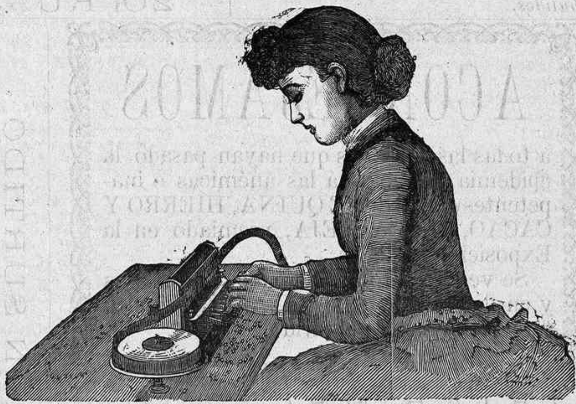
FIG. 2.ª—Perforación de la cinta.