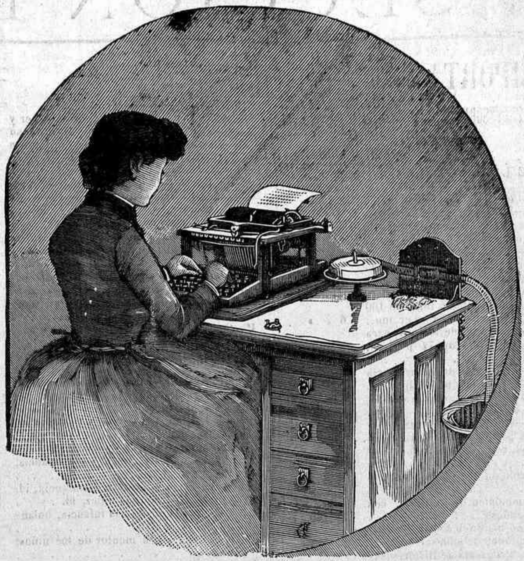
FIG. 3.ª—Perforador eléctrico.

T-O-E-D-I-T-O-R--S-C-I-E-N-T-I-F-I-C-A-M-E-R-I-C-A-N-