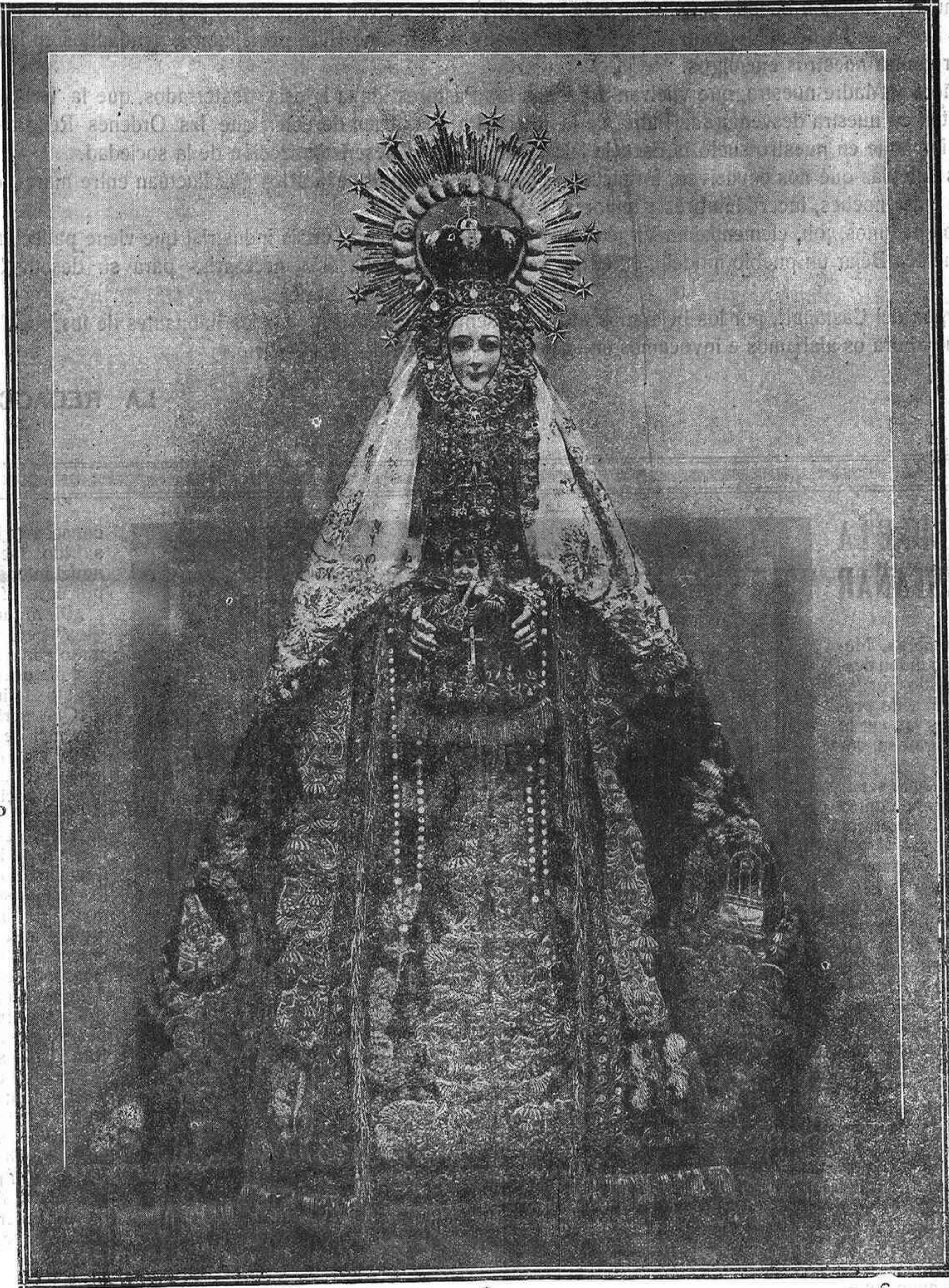
NUESTRA SEÑORA DEL CASTAÑAR EXCELSA PATRONA DE BEJAR