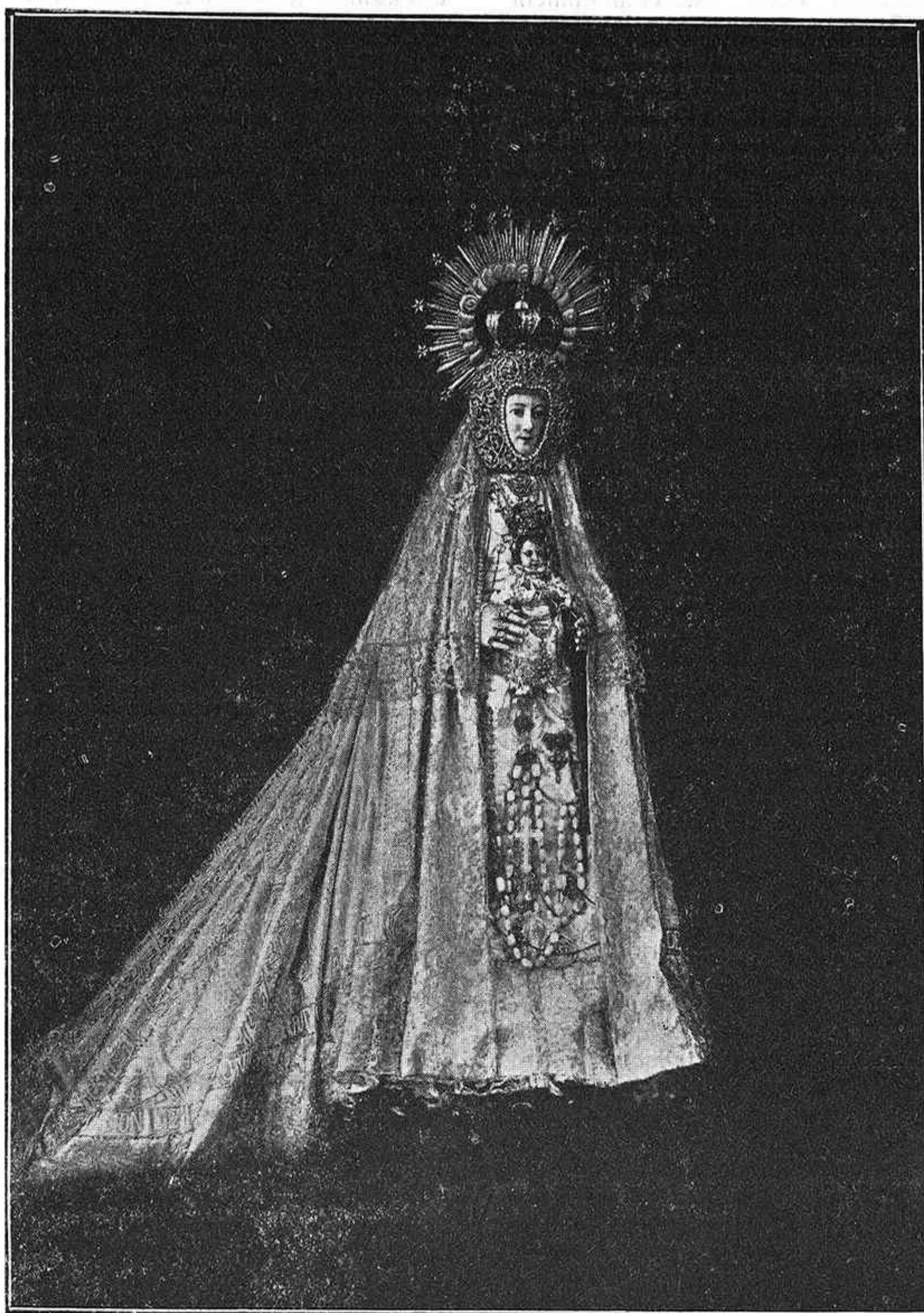
Nuestra Señora la Virgen del Castañar con el rico manto regalo de S. M. el Rey D. Alfonso XIII