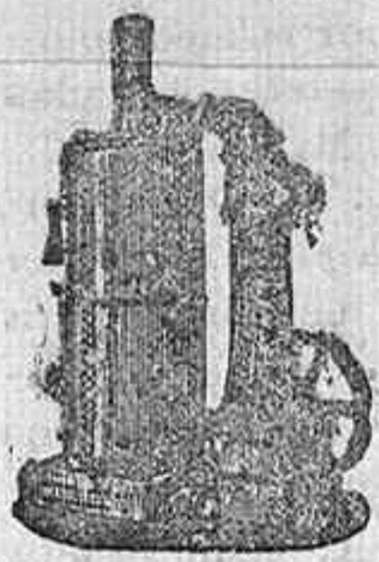
MAQUINA DE VAPOR VERTICAL.

ANTES PARSONS GRAEPEL Y STURGES DESPACHO, ALCALA, 52