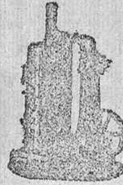
MAQUINA DE VAPOR VERTICAL.

Catálogos gratis y franco á quien los pida.