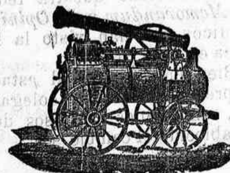
Máquina de vapor locom6vil

Máquinas de vapor, Bombas, Pesas, Tubos de todas clases, aparatos para hacer gaseosas y toda clase de maquinaria.