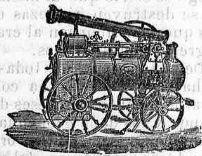
Máquina de vapor locomóvil

Máquinas de vapor, Bombas, Prensas, Tubos de todas clases, aparatos para hacer gaseosas y toda clase de maquinaria.