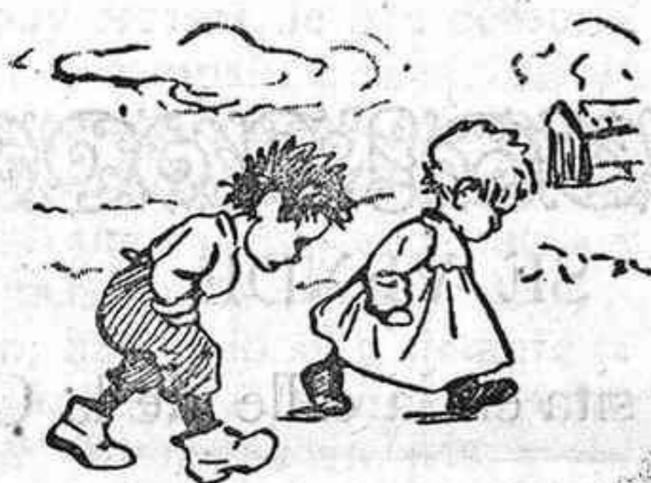
Van corriendo estos chiquillos al andén à buscar grillos.