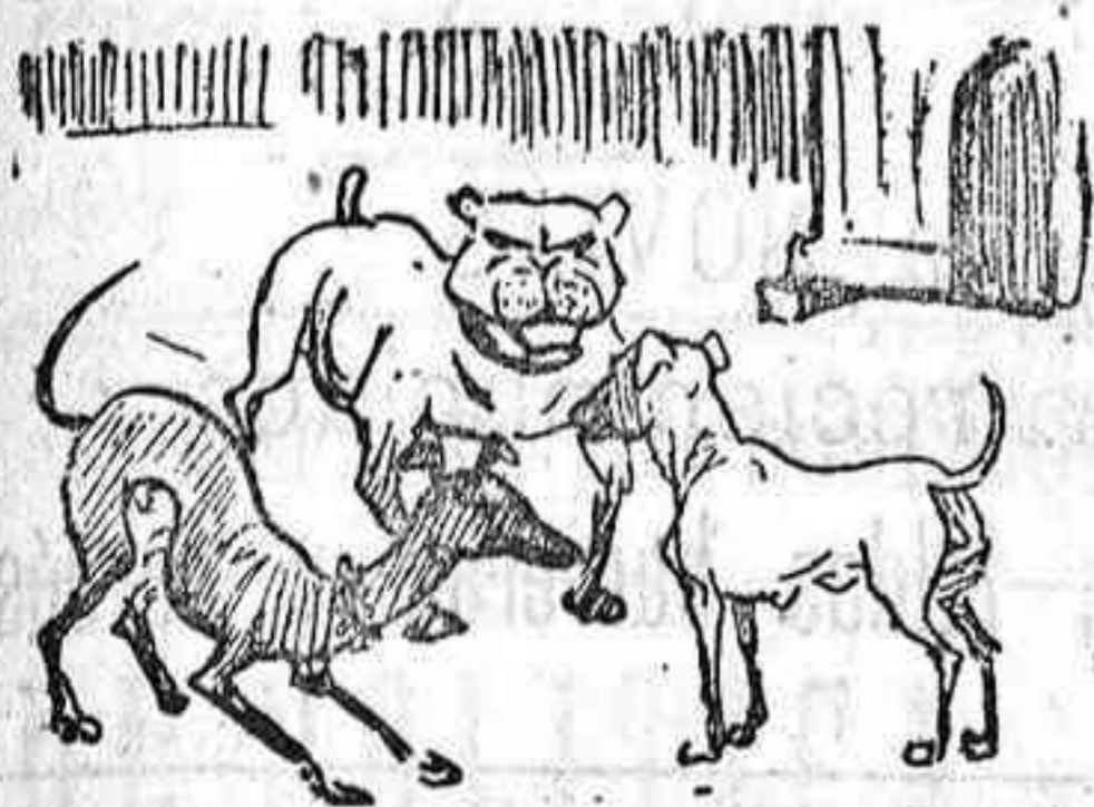
A pesar de que hay morcilla retozan à maravilla.