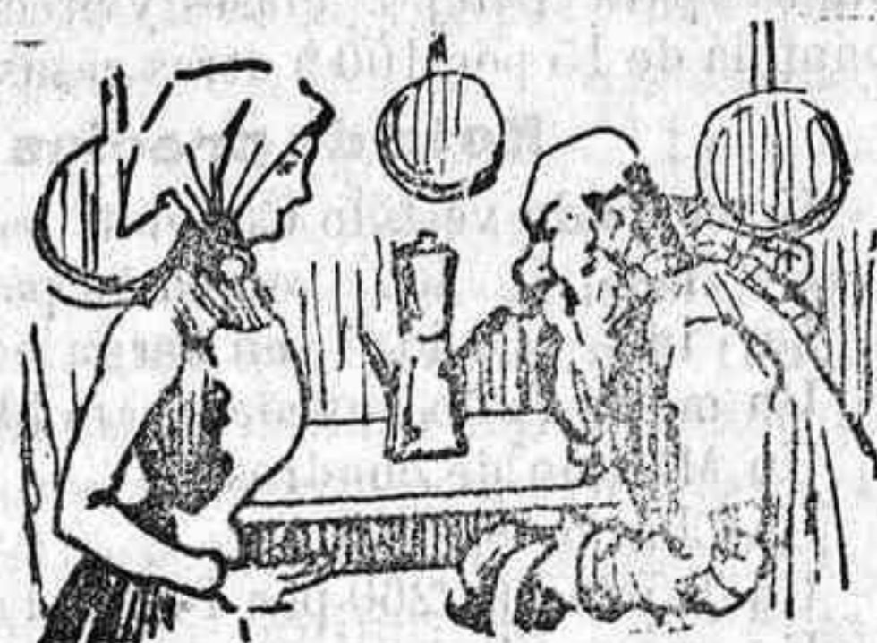
Di, Pepa, ¿eres aijonista? No señor, soy palacista.