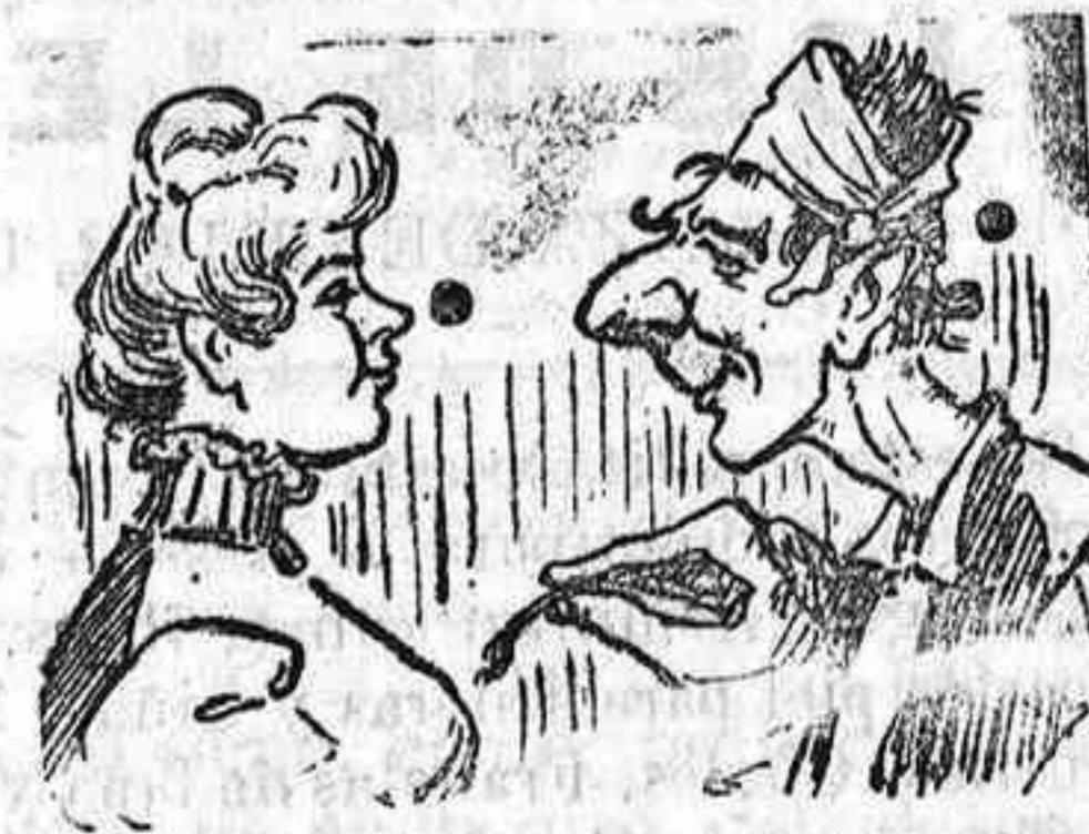
Contra tu nariz no elamo porque sé no eres del Amo.