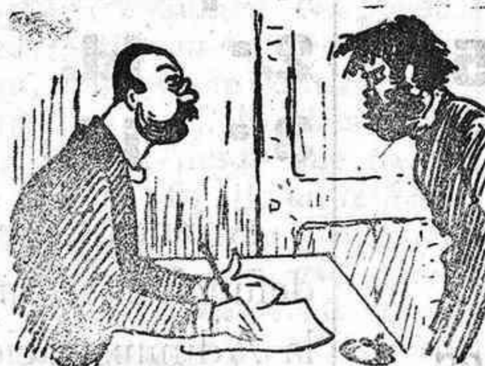
Va à dibujar al instante al caçiquismo expirante.