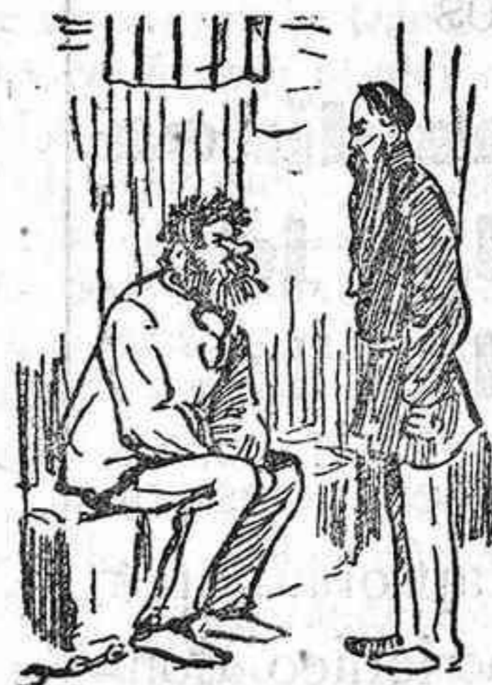
—¿Nombrarán al muchacho diputado? —Espere V. así, cual yo, sentado.