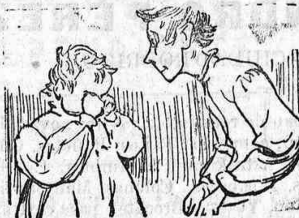
Chico, no estés apenado que perderá el del Collado