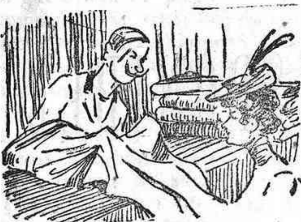
Este hortera me conquista porque sé que es palacista.