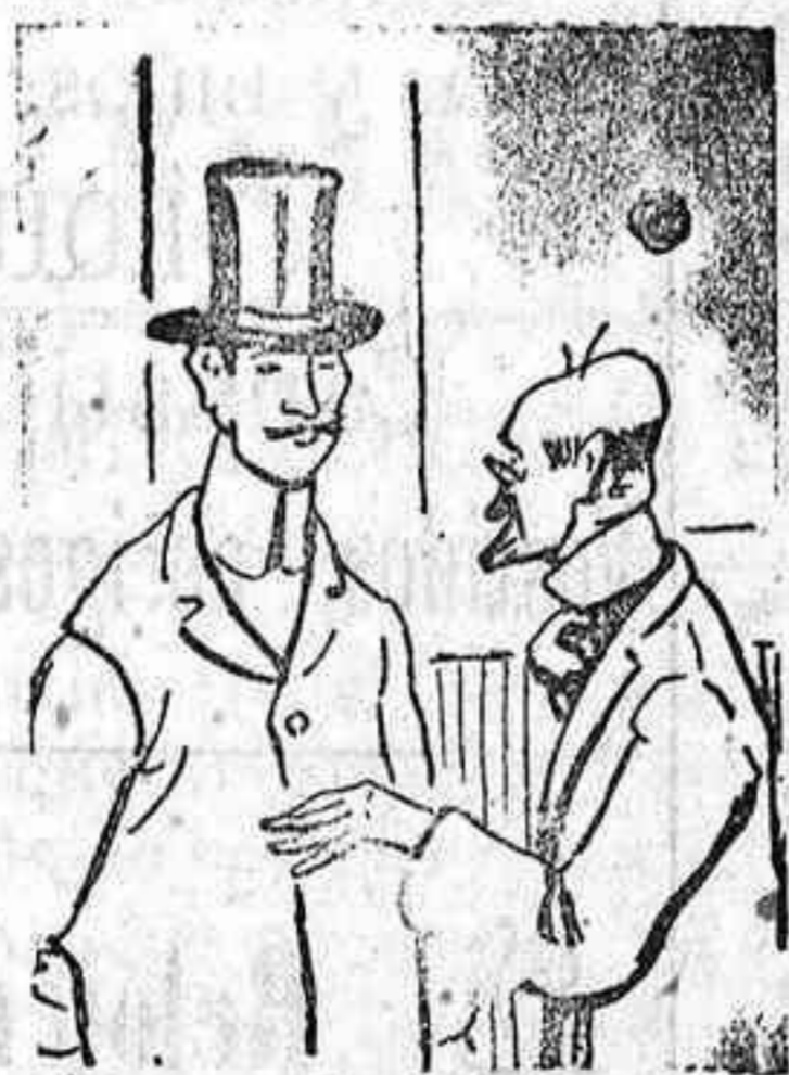
Padezco de alopecia de estudiar filología.