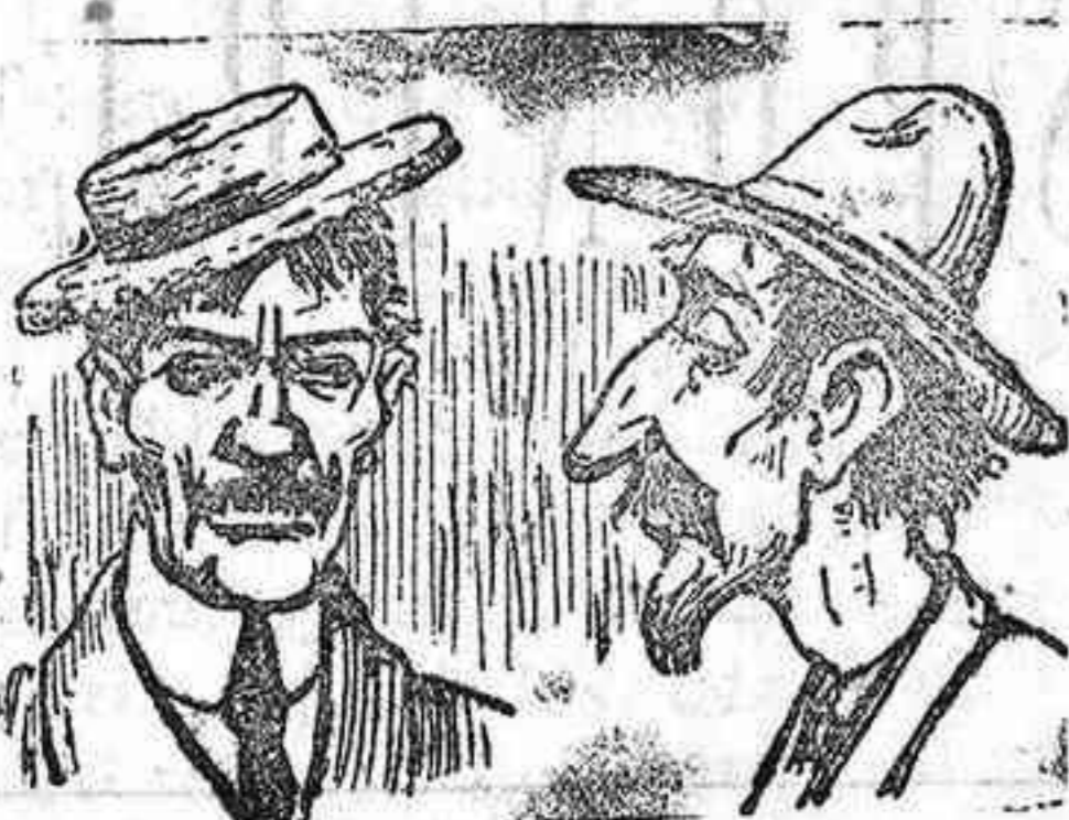
Estos dos artistas lacios piensan votar à Palacios.