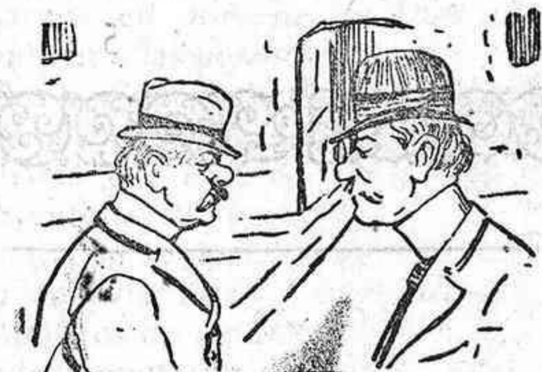
Ambos son muy modernistas pero aun son más palacistas.