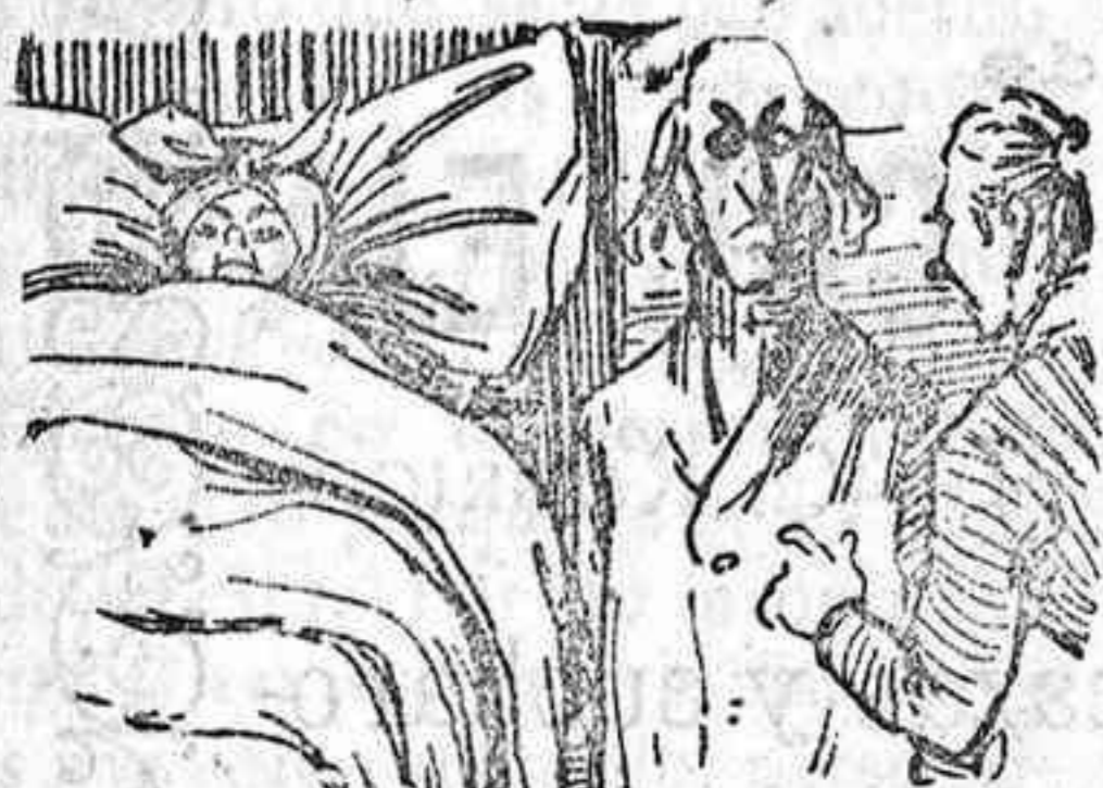
El Amo en cama postrado por la opinión desahuciado.