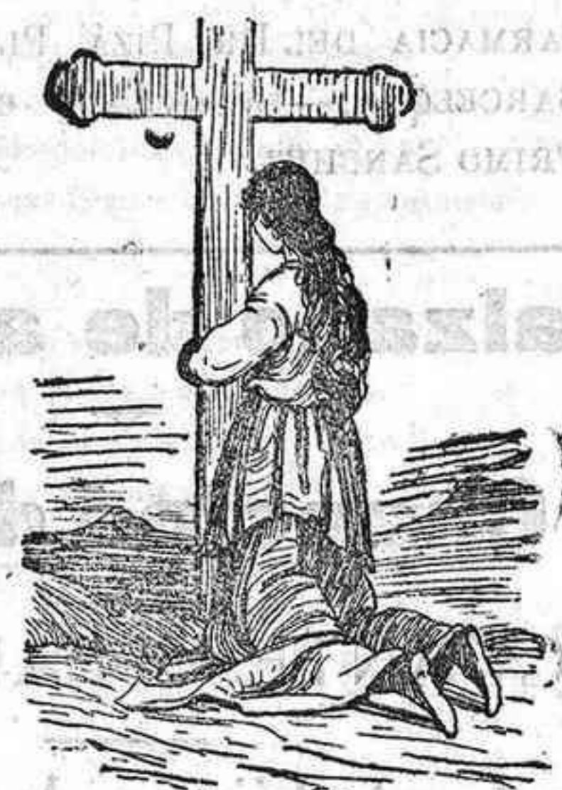
Al pié de una cruz bendita llorando me arrodillé, y con fervor religioso y unción cristiana exclamé: