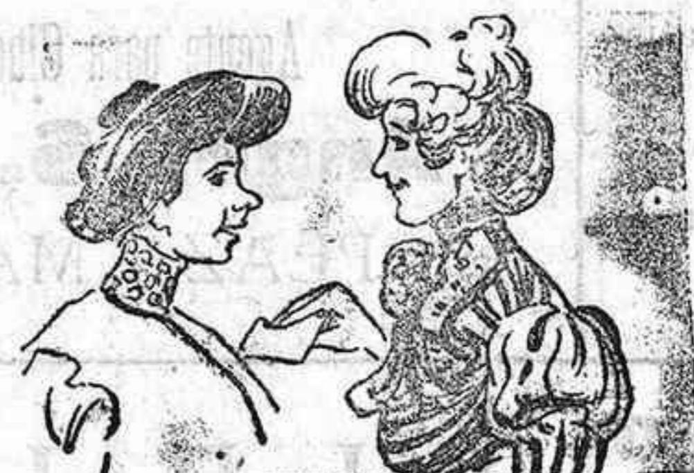
Al bello sexo conquista el que sea antiarjonista.