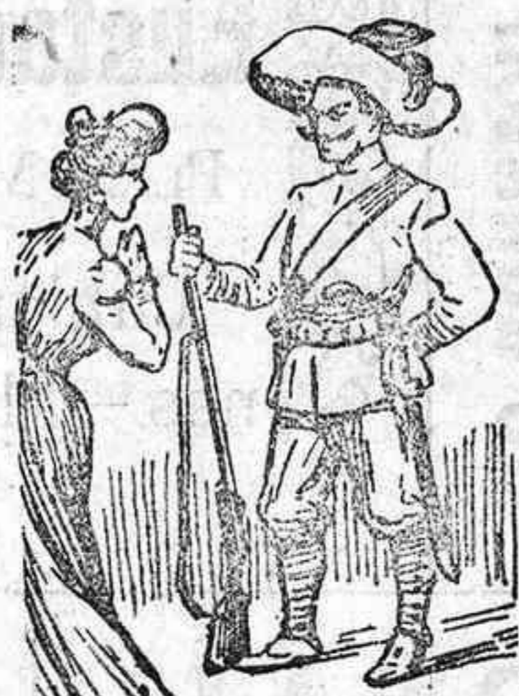
La dice adios para ir al caçique à combatir.