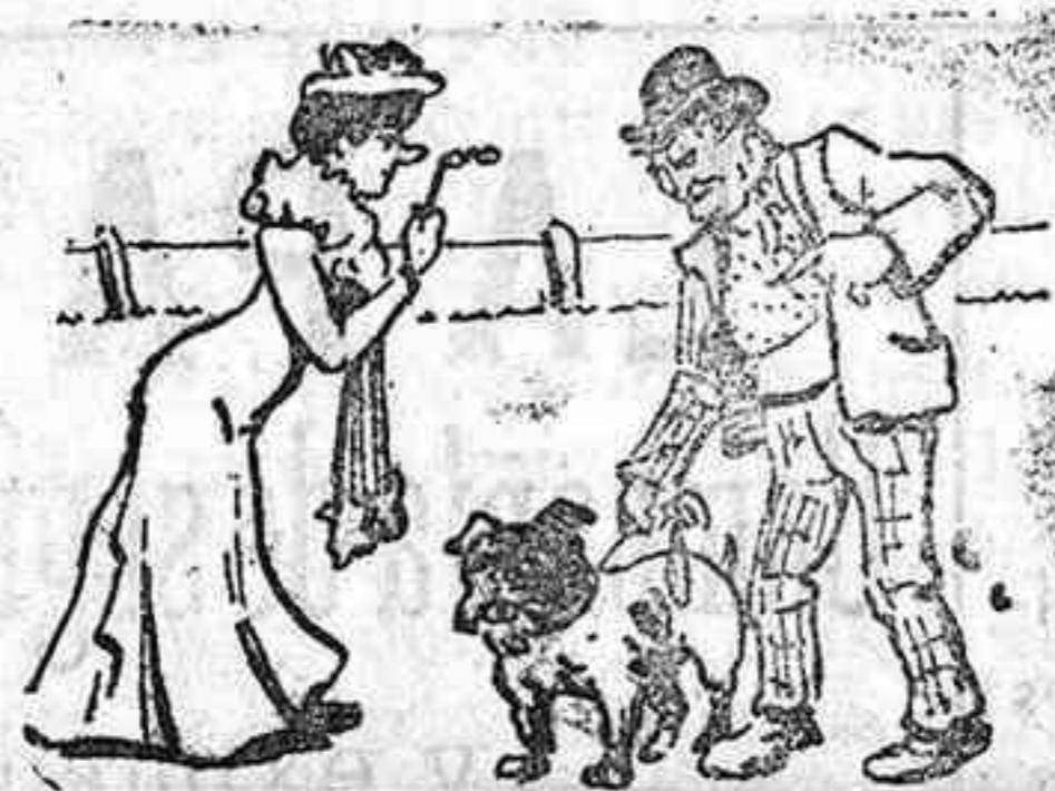
Ella y él y hasta el perrito no quieren à Gedeoncito.