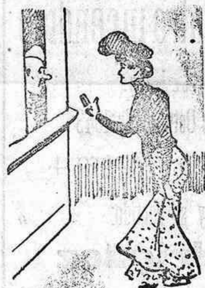
Te mereces por tu talle que den tu nombre à una calle.