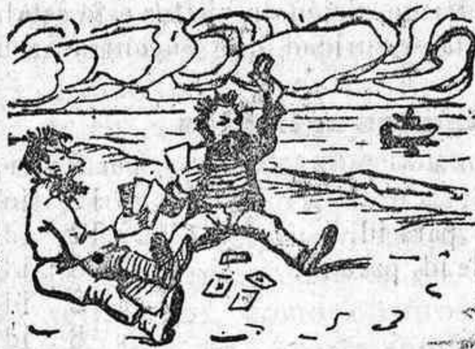
Con juegos y diversiones esperan las elecciones.