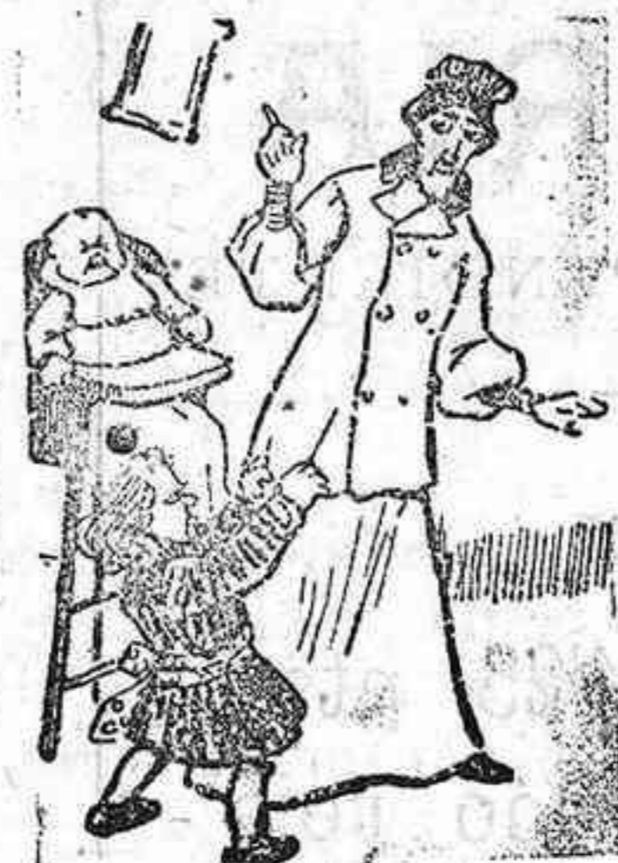
¡Cual gritan estos chavales! ¿Qué quereis? ¡Ser concejales!