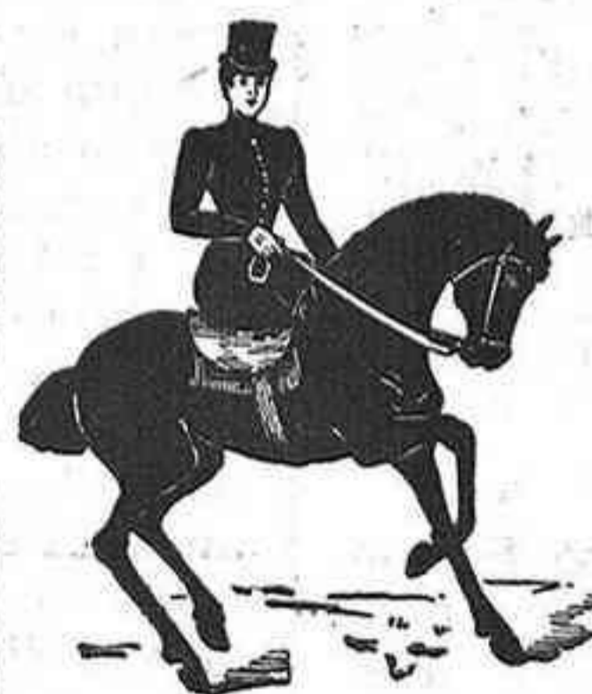
No confundirse: junto al Cuartel del Conde. 52-43