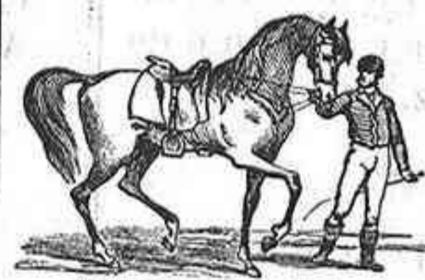
El caballo andaluz

Infinidad de caramelos.—Preciosas cajas para regalos.—Pasteles variados todos los días.—Riquisimas tartas.—Variados platos de postres.