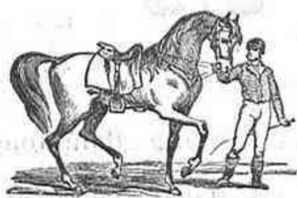
El caballo andaluz

Los vinos blancos son usados para consagrar en muchas diócesis, como puedo justificar con documentos.