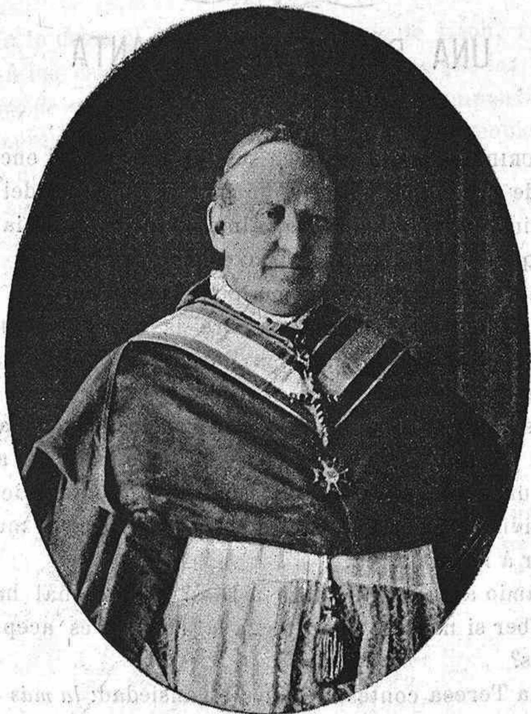
EL EMMO. SR. CARDENAL CRETONI

Su Santidad le preconizó en 1893 Arzobispo de Dama- so y en el mismo año se le confió la Nunciatura de Madrid. Por su afabilidad, por sus virtudes y exquisito tacto