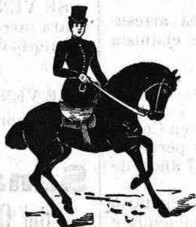
No confundirse: junto al Cuartel del Conde.