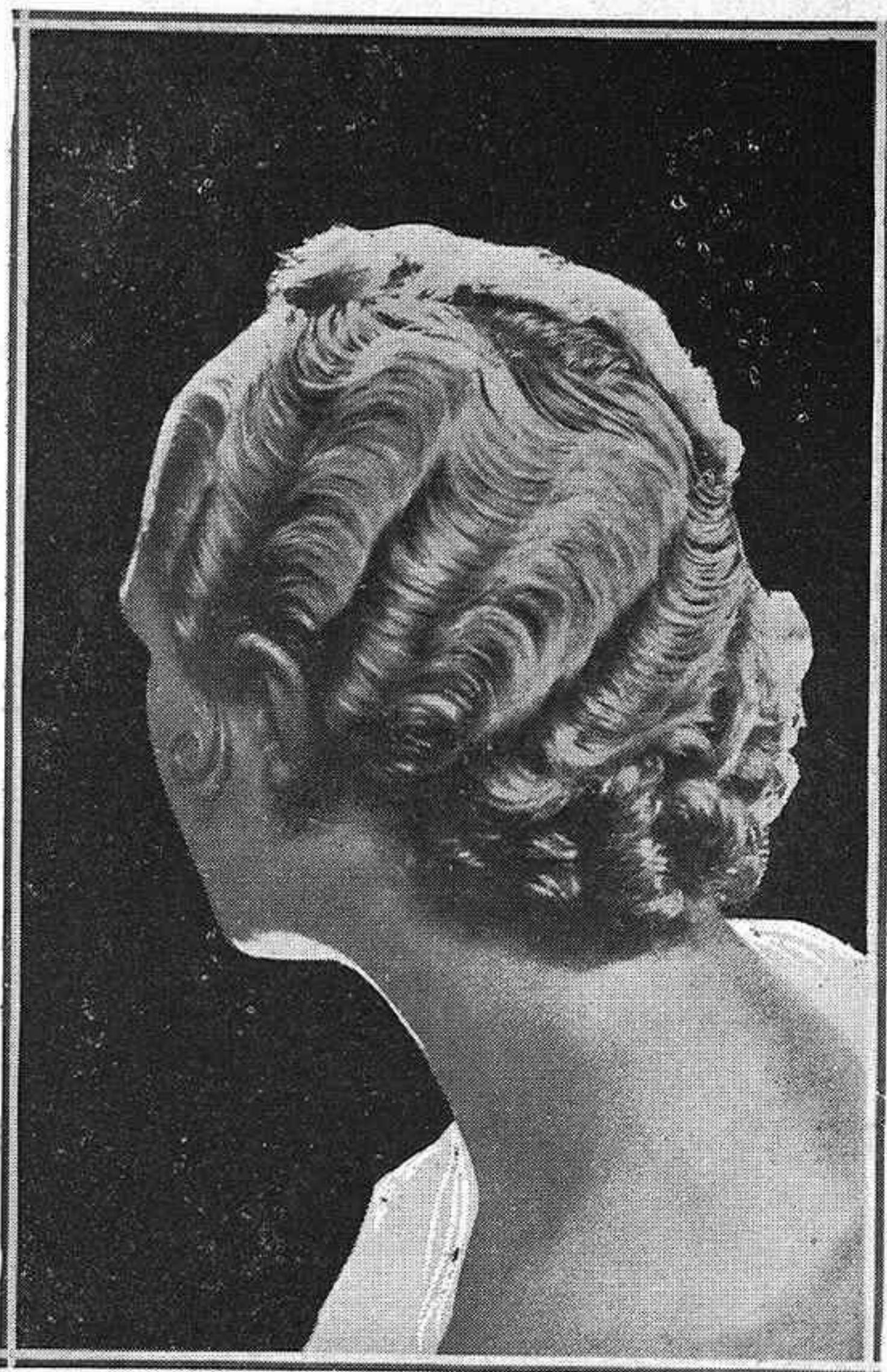
Bonito modelo de peinado, creación del peluquero Lillo

Por regla general se ven por la tarde pocos tonos en oposición; vestidos y