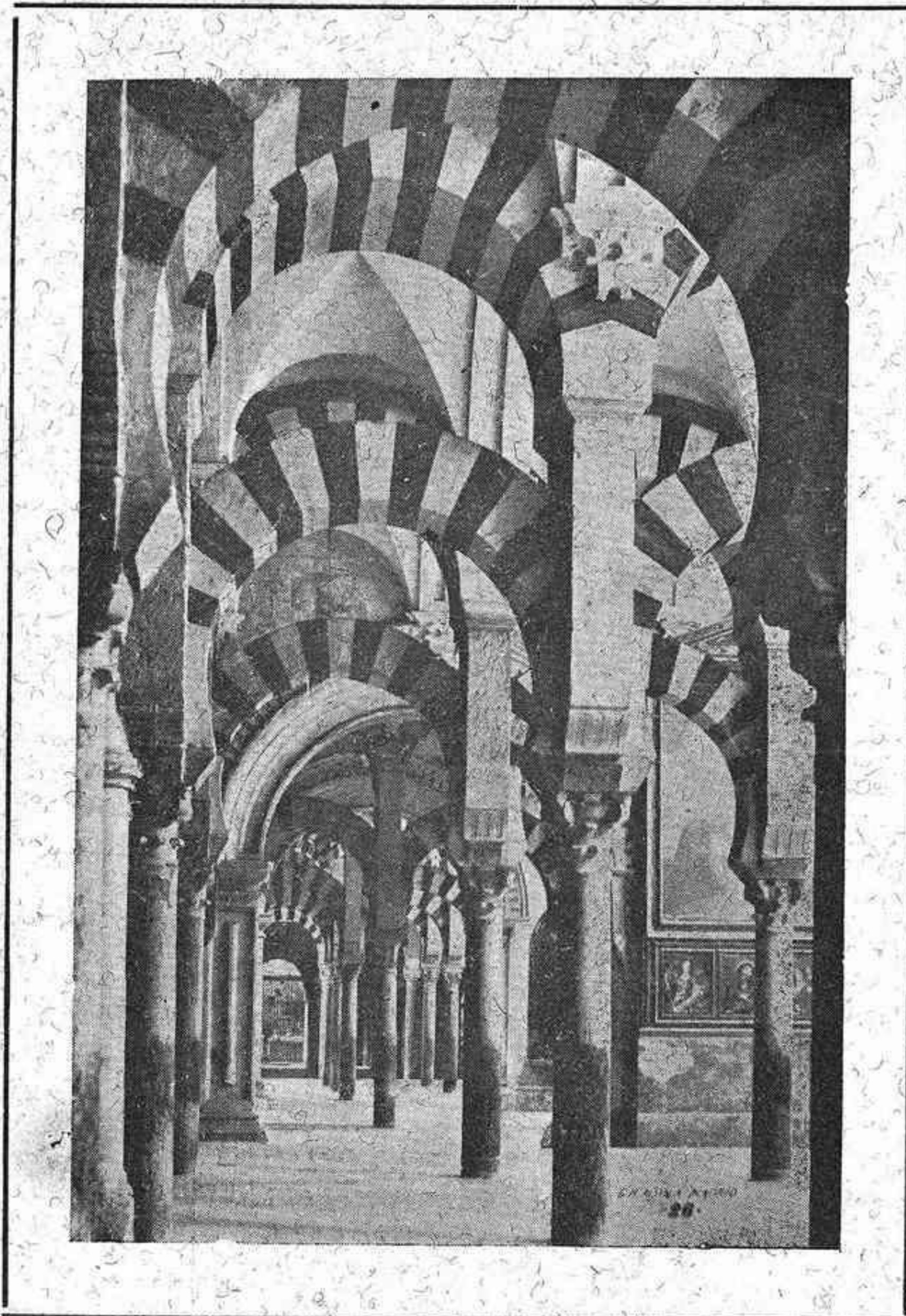
CÓRDOBA: Interior de la Catedral

Organo de la Federación de Sindicatos Católico-Agrarios de Córdoba