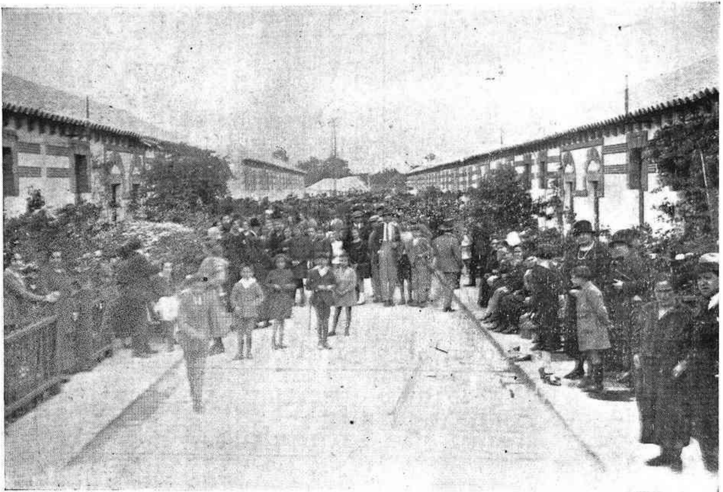
CÓRDOBA: Grupo de casas baratas edificado en el Marrubial por «La Solariega de Córdoba» inaugurado recientemente

Organo de la Federación de Sindicatos Católico-Agrarios de Córdoba