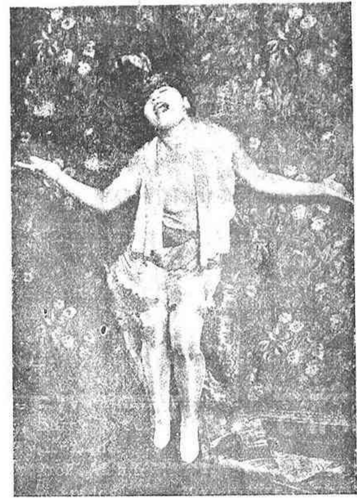
Leila Hyams, de la Metro Goldwyn Mayer