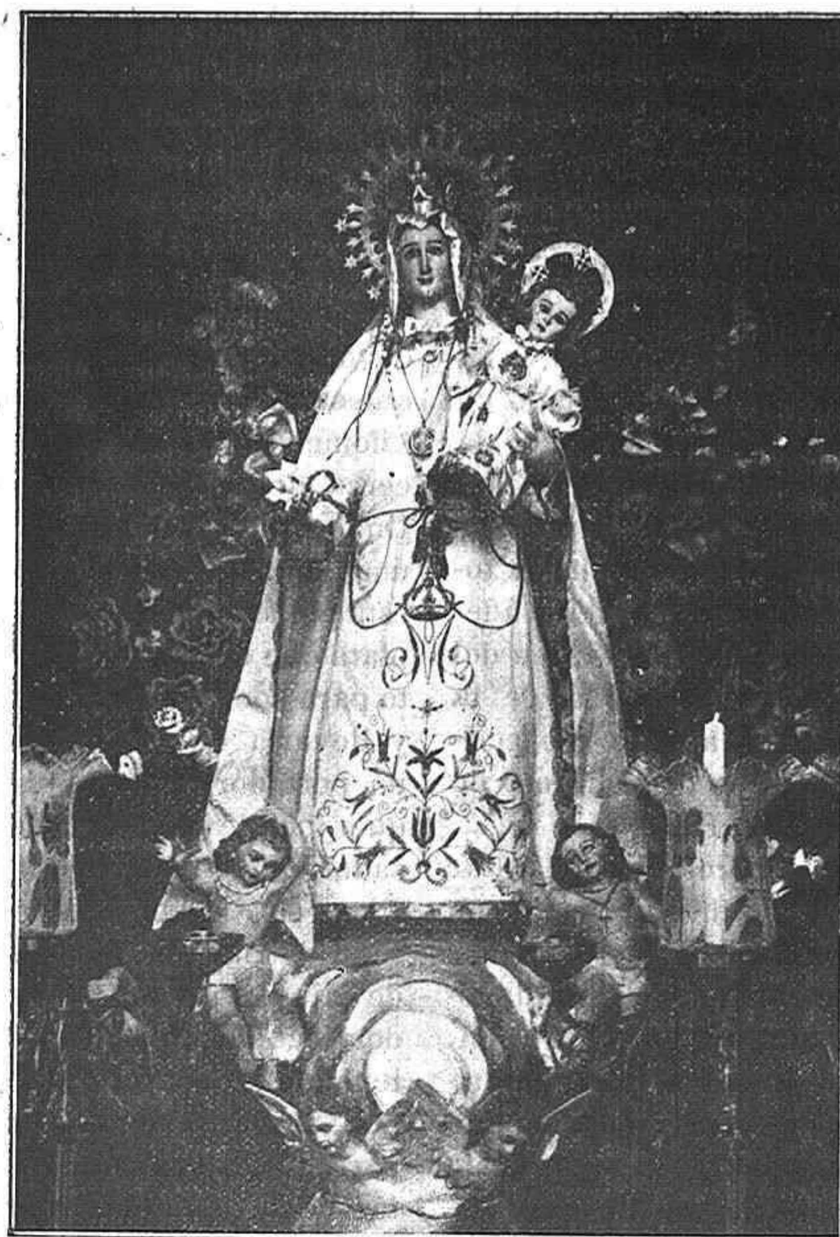
NUESTRA SEÑORA DE LOS ANGELES

que se venera en Baena, en la ermita de su nombre